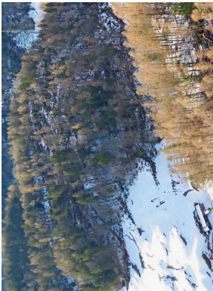
Furtschkopf und Eichbüel, Mädris