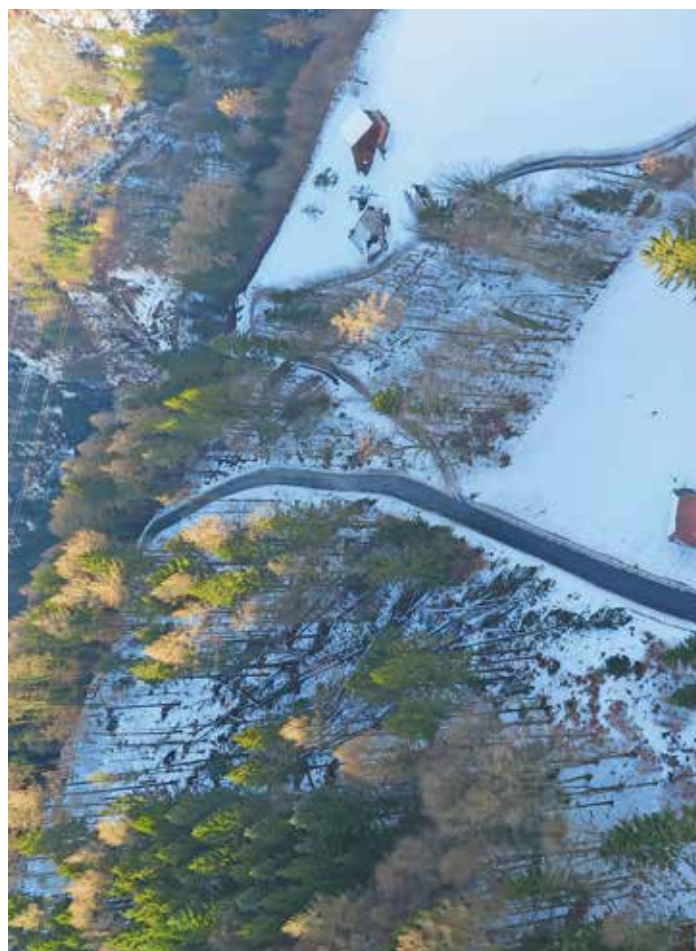
Blees / Rütiwald